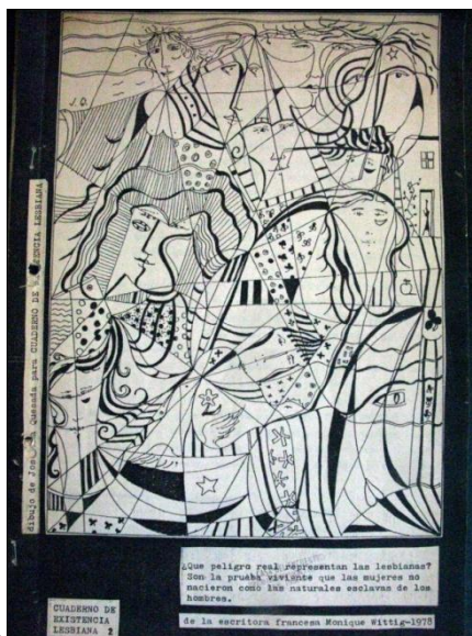
Fotografía 2. Tapa de Cuaderno N°2