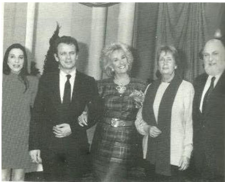
Fotografía 3. Ilse Fusková junto a Mirtha Legrand