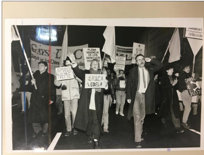
Fotografía 4. Primera Marcha del Orgullo Buenos Aires