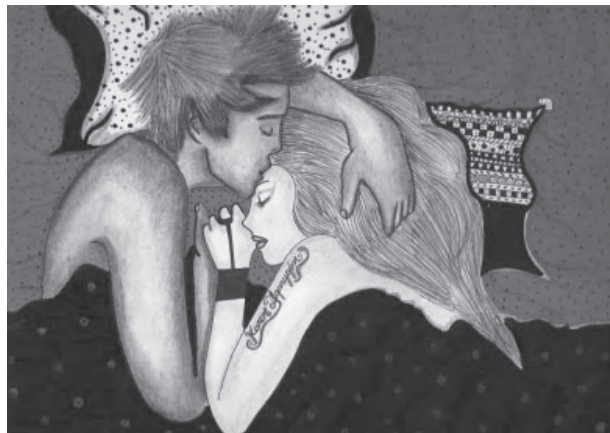
Título: Beso de buenos días. Técnica: mixta. Dimensiones: 22cm x 28 cm. Año: 2013.

...El amor es un tema muy complicado y muy difícil de tratar; es algo o que simplemente llega, un día nos sentimos de manera normal y al otro tenemos mil mariposas revoloteando en el estómago.