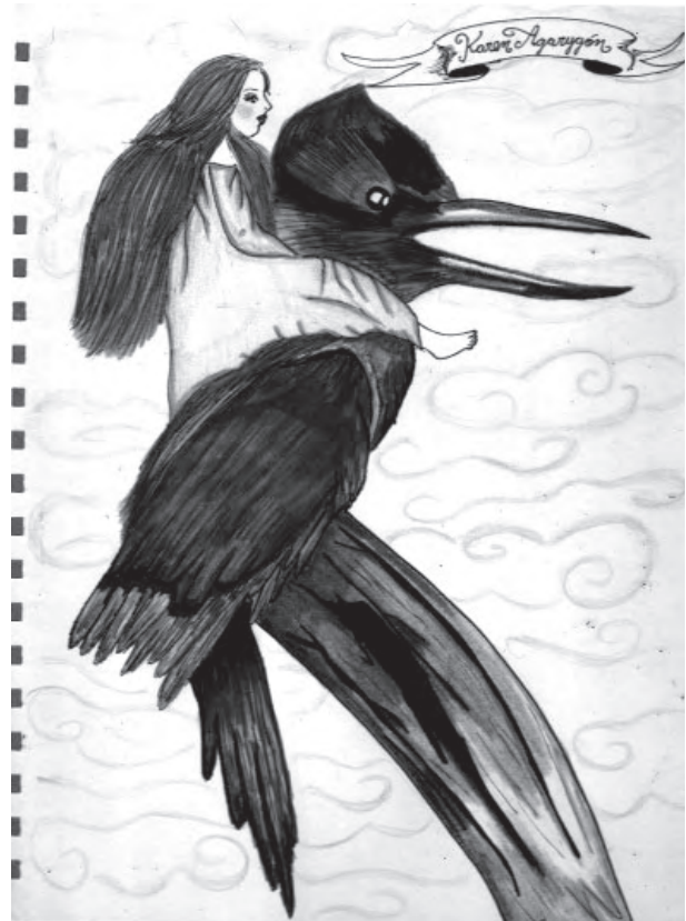
Título: Azul. Técnica: mixta. Dimensiones: 22cm x 28 cm Año: 2012

La mujer ocupa el tema central de mis trabajos de investigación; siempre es la protagonista, la que teje estas historias y la que las vive. Siempre me ha inquietado la forma como las mujeres nos comportamos, porque nos han dado una educación