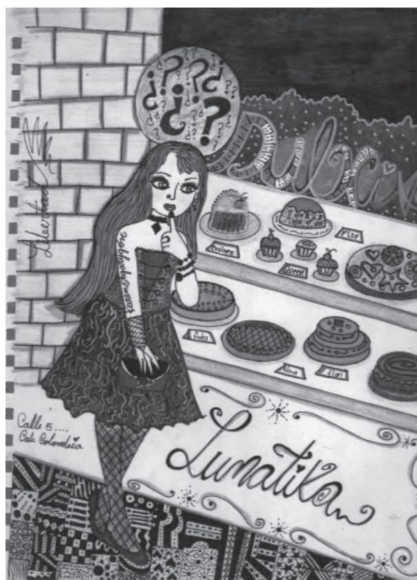
Título: Paseo por la calle quinta. Técnica: mixta. Dimensiones: 22cm x 28 cm. Año: 2012

Este dibujo “paseo por la calle quinta”, lo hice pensando en las mujeres que no se atreven a salir solas para darse un gustico; en primer lugar porque