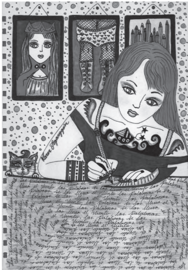
Título: Fémica. Técnica: mixta. Dimensiones: 22cm x 28 cm. Año: 2012.