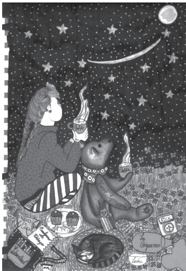
Título: La hora del café. Técnica: mixta. Dimensiones: 22cm x 28 cm. Año: 2012

Es un viaje desde lo exterior para mirar y admirar lo interior y observar hasta las cosas más mínimas para convertir a la mujer en la protagonista de su propia historia.