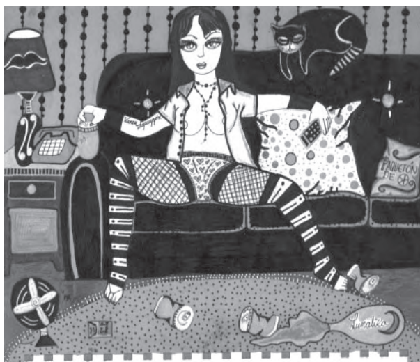
Título: Fuera de postura. Técnica: mixta. Dimensiones: 22cm x 28 cm. Año: 2012.

Esta imagen presenta ese momento a solas que no debería distinguir género, sin embargo esta pose