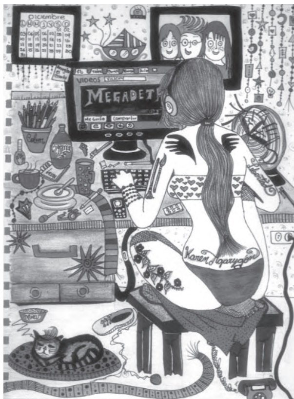
Título: Ideas de libertad. Técnica: mixta. Dimensiones: 22cm x 28 cm. Año: 2012

Este dibujo se titula “ideas de libertad”. Para mí esas ideas consisten en ver a la mujer como un ser independiente, autónomo y autosuficiente económicamente. He querido dejar un registro de mis opiniones frente al mundo... Hay cosas demasiado íntimas que no quisiera ventilárselas a un posible lector, pero es tan necesario poder hablar conmigo misma, que esos escritos los camuflé de muchas maneras, así puedo sacar todos esos sentimientos que causan pesadez en mi interior,