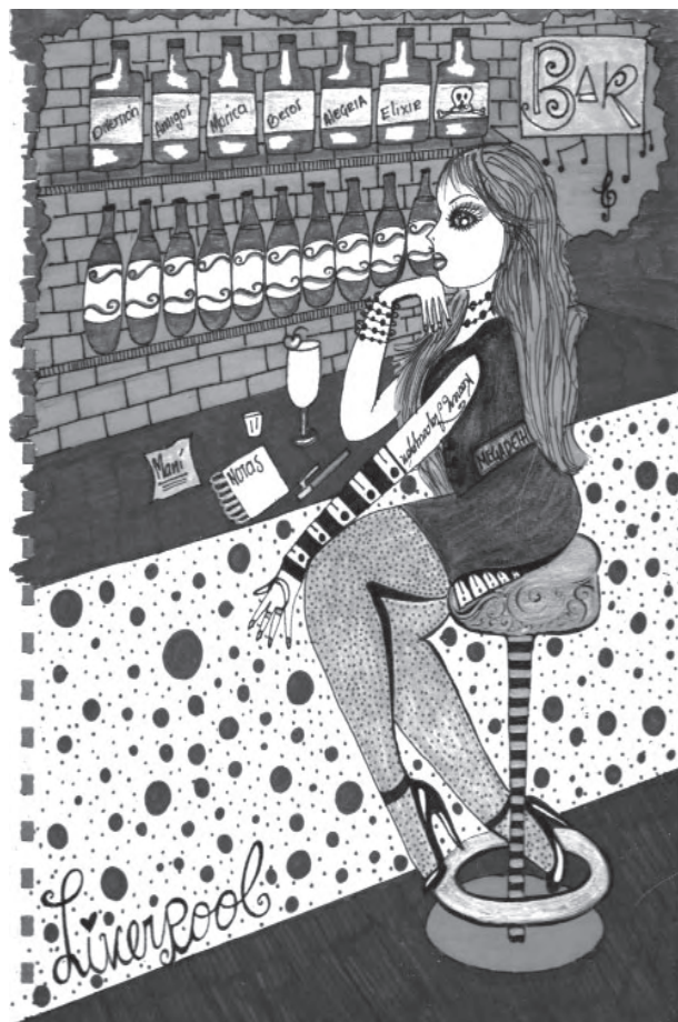
Título: una chica sola en la barra de un bar. Técnica: mixta. Dimensiones: 22cm x 28 cm. Año: 2012

De esa experiencia nació este dibujo, que tiene por nombre, Una chica sola tomando en la barra de un bar.