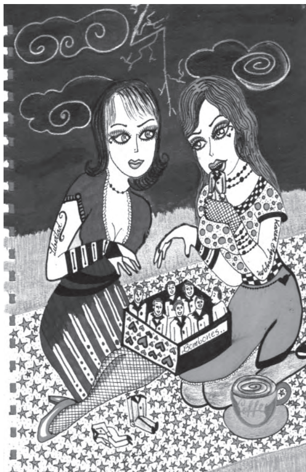
Título: las devoradoras de hombres. Técnica: mixta. Dimensiones: 22cm x 28 cm. Año: 2012.

Hasta hace muy poco los hombres eran quienes escogían a la mujer con características afines a sus gustos, ellos eran quienes decidían e iban a conquistar. Ahora las cosas han cambiado, nosotras ahora podemos decidir con quién estamos y con quién no, quién nos gusta y quién no, de hecho hasta contamos con los recursos económicos para poder invitarlos a salir, o podemos pagar lo que consumimos cuando nos invitan o los invitamos.