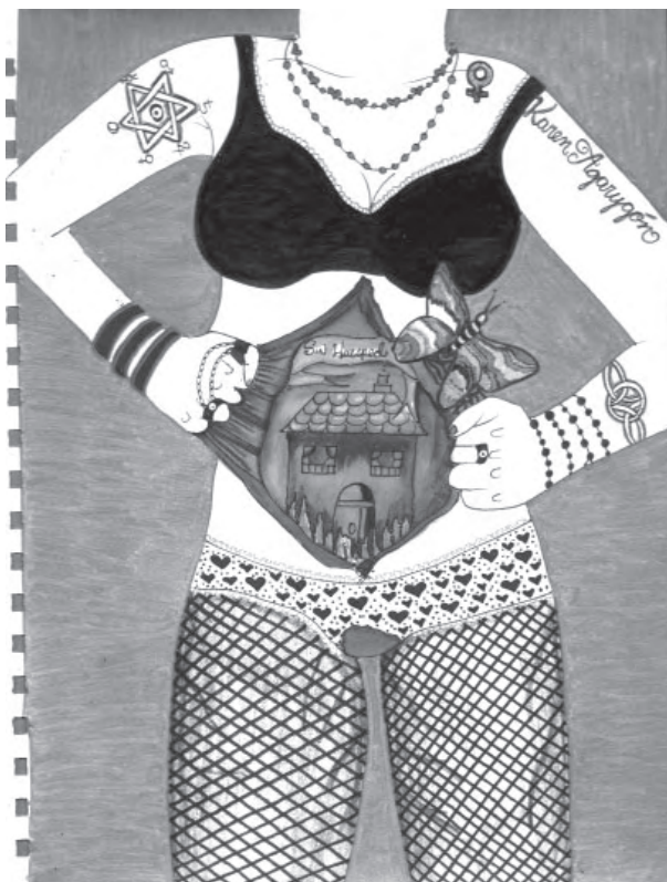
Título: sin huésped. Técnica: mixta. Dimensiones: 22cm x 28 cm. Año: 2013.

Este dibujo toca el tema de la regla en las mujeres. La menstruación es un proceso complejo y bastante misterioso, trastorna todo el organismo de la mujer, puesto que está acompañado de secreciones hormonales que reaccionan sobre glándulas como la tiroides y la hipófisis, también sobre el sistema nervioso central y el sistema vegetativo y por consiguiente sobre todas las vísceras; por eso casi todas las mujeres presentamos trastornos durante este periodo.