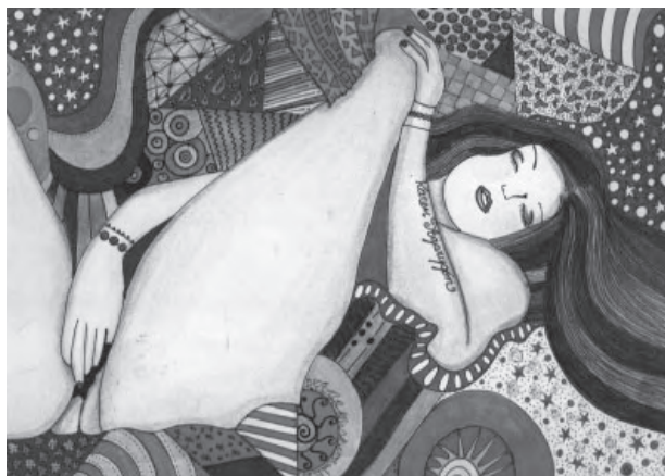
Título: un ratico para mi sola. Técnica: mixta. Dimensiones: 22cm x 28 cm. Año: 2013.

Maureen Murdock. Ser mujer, un viaje heroico